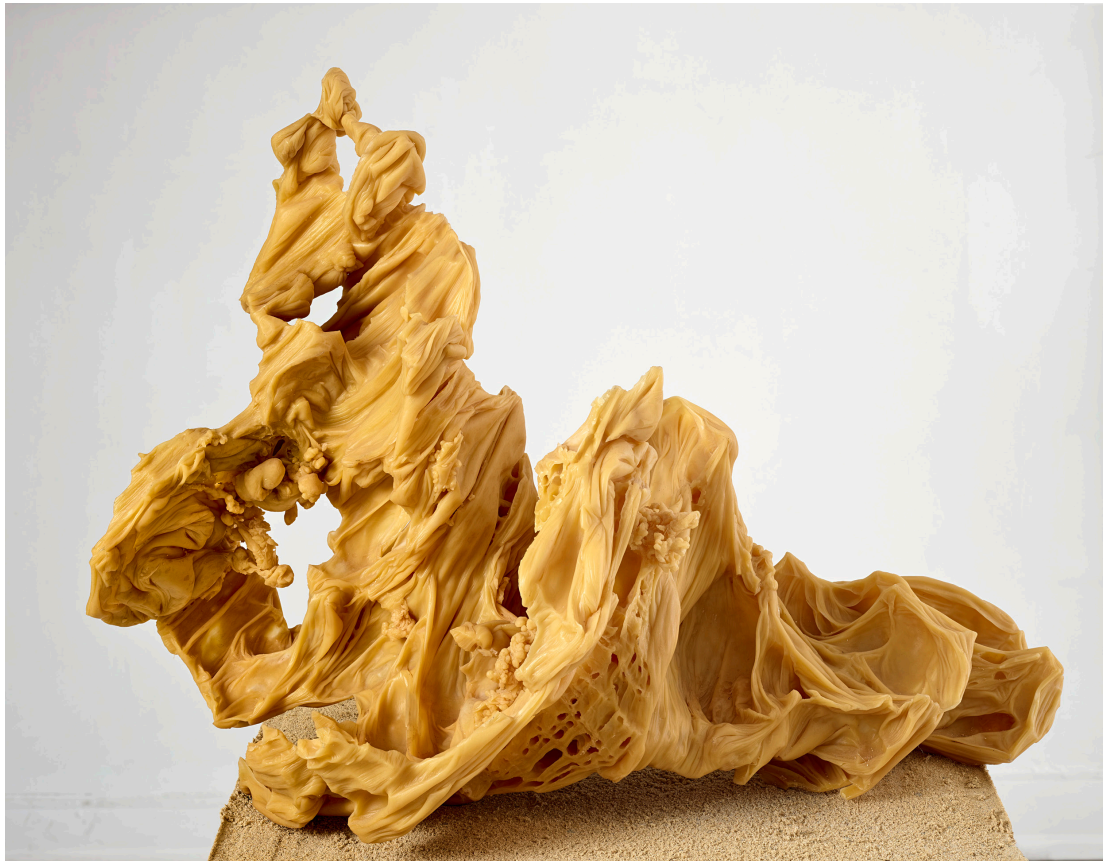
Strata 2015 Cire d'abeille et sable 28 x 74 x 25 cm