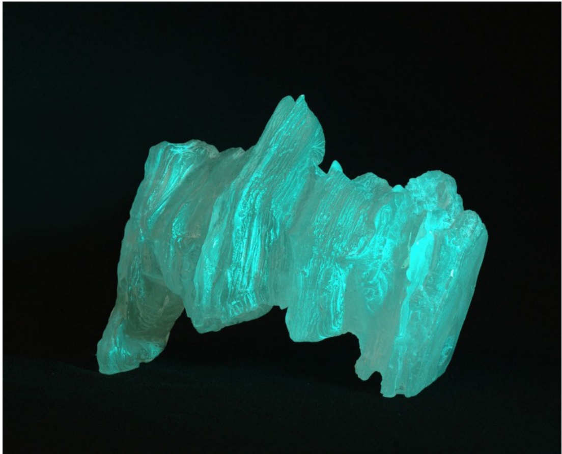
Fantôme II 2016 Pâte de verre 14 x 32 x 16 cm